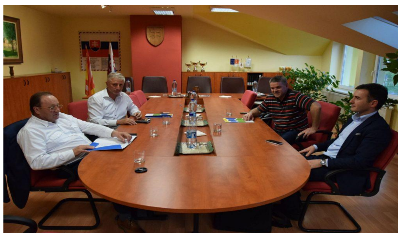
Obrázok 3: Rokovanie s predstaviteľmi regionálnych ZMOS-ov

Ide najmä o konkrétne služby členom v podobe na mieru šitého poradenstva v oblasti inovácií, prepojenia výskumu s praxou, ako aj o transfer poznatkov a informačné aktivity s cieľom poskytnúť informácie o možnostiach spolupráce, inovačných projektoch, zaujímavých podujatiach a pod. Rovnako informácie, ktoré klaster rozosiela relevantným partnerom, sú filtrované podľa témy a identifikovaného záujmu. Súčasťou transferu poznatkov sú tiež podujatia organizované KRR pre svojich členov a partnerov, ktoré vytvárajú priestor na vzájomné interakcie. Klaster vytvára zázemie na výmenu skúseností a to organizovaním priamych stretnutí aktérov formou seminárov, workshopov alebo kontaktných pracovných stretnutí.