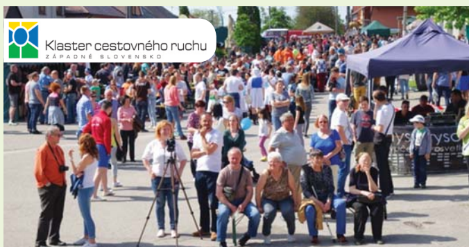
Návštevníci festivalu v Prievaloch.