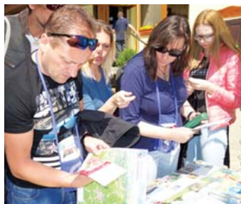
Návštevníci propagačného stánku klastra.