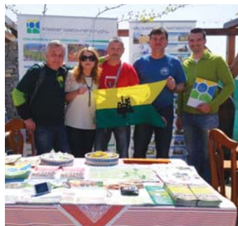
Propagačný stánok klastra.