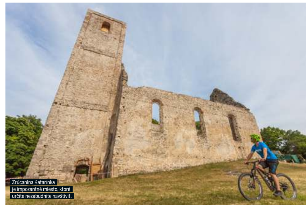
Zrúcanina Katarínka je impozantné miesto, ktoré určite nezabudnite navštíviť.

CYKLOSERVIS Cyklocentrum predajňa Rybníkova 15 Mestská športová hala Trnava 917 01 Trnava Tel.: 033 55 05 136, 0907 722 989 predajna@cyklocentrum.info www.cyklocentrum.info