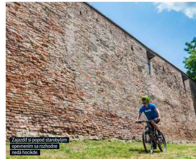
Zajazdiť si popod starobylým opevnením sa rozhodne nedá hocikde.