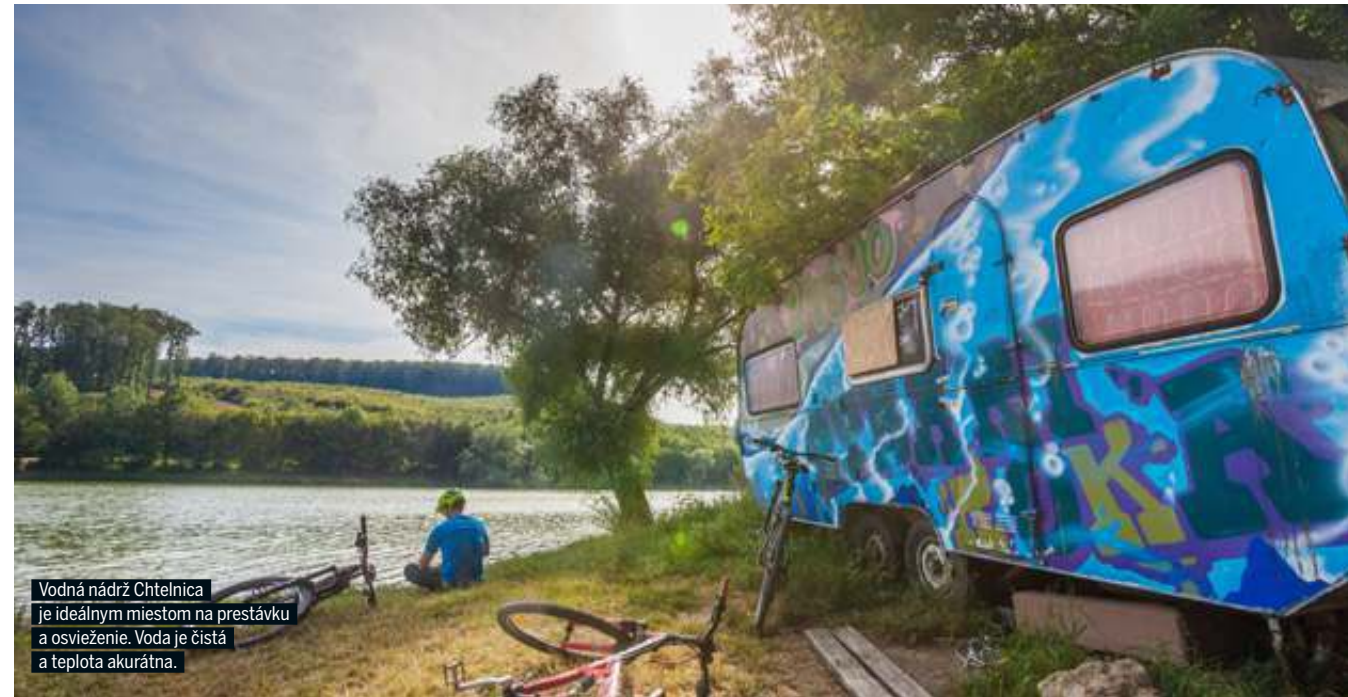
Vodná nádrž Chtelnica je ideálnym miestom na prestávku a osvieženie. Voda je čistá a teplota akurátna.

Spojíte tak príjemné s užitočným a z výletu si odnesiete oveľa viac ako „len“ odkrútené kilometre. Ak by sme mali vypichnúť jednu vec, ktorá celú oblasť vystihuje, je to práve schopnosť osloviť nesmierne širokú škálu ľudí, ktorí by možno bikovať „bez cieľa“ nikdy nešli. Ak ste teda Trnavu a jej blízke okolie doteraz nenavštívili, je načase to zmeniť. Na relatívne malej ploche tu toho môžete zažiť vskutku veľa. A čo viac ako aktívnu dovolenku či prázdniny si človek môže priať?