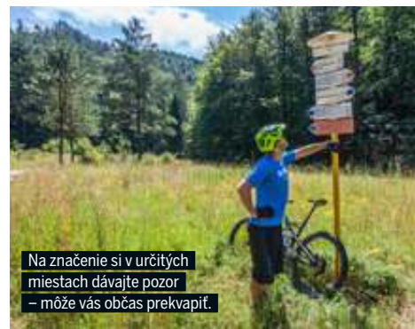
Na značenie si v určitých miestach dávajte pozor – môže vás občas prevapíť.

Na tejto časti Trnavského kraja je skvelé, že si môžete bikovanie ozvláštniť. Cyklotrasy, aj keď dlhšie, nepatria k extrémne náročným a prechádzajú rôznorodým a nesmierne zaujímavým prostredím. Z bikovačiek si tak dokážete urobiť viac ako len športové vyžitie. Môžete vďaka nemu spoznať ďalšiu časť Slovenska, ktorá doslova v každej dedine ponúka niečo výnimočné. Nezáleží na tom, či vás zaujímajú zrúcaniny, zachovalé kaštiele, sakrálné stavby, múzea, zreštaurované mlyny alebo máte chuť sa po jazdení len tak vyvaliť niekde pri vode. Nájdete tu úplne všetko, navyše blízko pri sebe.