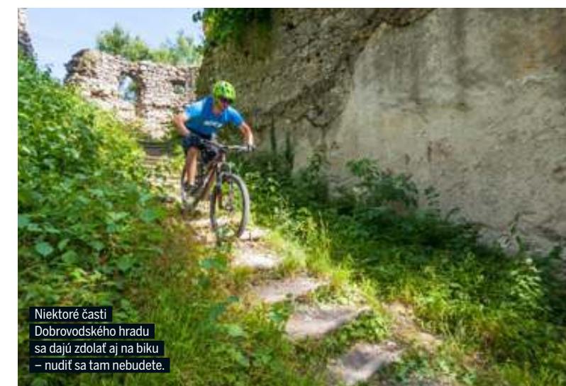
Niektoré časti Dobrovodského hradu sa dajú zdolať aj na biku – nudí sa tam nebudete.

Ako napovedá samotný názov (Trnavská pahorkatina), okolie Trnavy je plné menších kopčekov, takže pri jazde sa rozhodne nebudete nudiť. Aj najdlhší okruh, ktorý vedie z malého Ríma do Kapráť, sa vinie pomedzi polia a dedinky ponúka množstvo stúpaní a klesaní, ktoré sa takmer neustále striedajú. Počas našej návštevy prebiehala na poliach žatva, čím bolo jazdenie ešte nevšednejšie. Okolo samotných cyklotrás, ktoré sú najmä v lesoch veľmi príjemné, nájdete množstvo rôznych výnimočných miest, ktoré vám rozhodne odporúčame navštíviť. Jedným z týchto miest je aj zrúcanina Katarínka, teda ruiny starobylého Kostola a Kláštora sv. Kataríny Alexandrijskej, ktoré už od roku 1994 reštaurujú dobrovoľníci. Okrem samotných stavieb však rekonštruujú, respektíve nanovo stavajú aj úzkorozchodnú lesnú železnicu, ktorá vyzerá