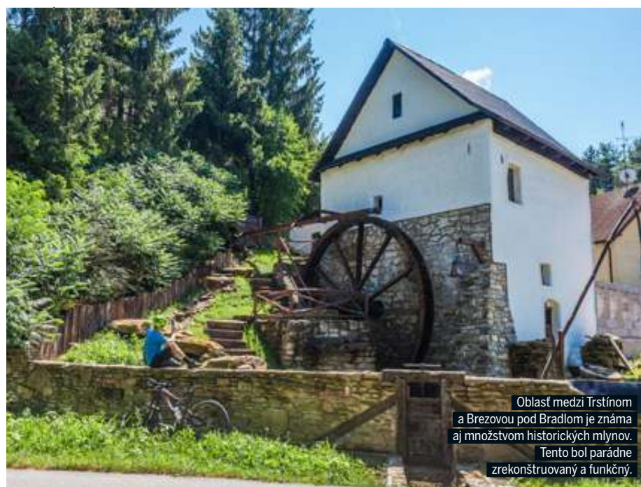
Oblasť medzi Trstínom a Brezovou pod Bradlom je známa aj množstvom historických mlynov. Tento bol parádne zrekonštruovaný a funkčný.

My sme sa rozhodli vyskúšať veľký okruh vedúci do Karpát a späť. Zároveň tiež zaujímavú spojnicu medzi obcou Kátlovce a Brezovou pod Bradlom a nakoniec cyklotrasu vedúcu priamo cez mesto. Veľmi dôležitým bodom nášho výletu bola dedinka s názvom Dobrá Voda, ktorá má ideálnu polohu hneď z viacerých pohľadov. Križujú sa tu totiž dve cyklotrasy spomínané vyššie, pričom tu máte na výber viacero možností, ako a kam sa na biku dostať. V prvom rade sa obec nachádza priamo „pod lesom“, takže šliapanie nudných kilometrov na začiatku každej trasy týmto odpadáva v prípade, že si chcete výlet ulahčiť či