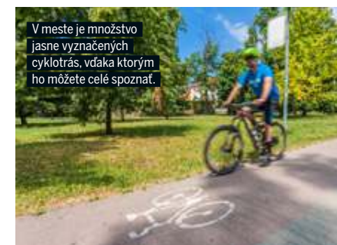
V meste je množstvo jasne vyznačených cyklotrás, vďaka ktorým ho môžete celé spoznať.

Pre všetkých, ktorí netušia, prečo práve „malý Rím“: „Trnava je na Slovensku jedným z najdôležitejších centier rímskokatolíckej cirkvi a stojí tu množstvo jej kostolov, takže dostala túto prezývku“ hovorí Wikipédia. Patrí tiež medzi najstaršie na Slovensku (prvá písomná zmienka je z roku 1211) a jej história je skutočne bohatá. Zároveň je krajským mestom, 7. najväčším v krajine a leží v centre Trnavskej pahorkatiny. Toľko zopár základných faktov. Bohatá história mesta zanechala výrazné stopy – množstvo architektonických a kultúrnych pamiatok. Napríklad taká prechádzka historickým centrom, ktoré tvorí mestskú pamiatkovú rezerváciu, poskytuje možnosť zoznámiť sa s pozoruhodným architektonickým súborom, ktorý sa tu formoval niekoľko storočí. Takmer pravidelný pôdorys centra mesta je vymedzený mestským