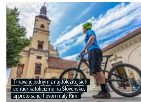
Trnava je jedným z najdôležitejších centier katolíckemu na Slovensku, aj preto sa jej hovorí malý Rím.