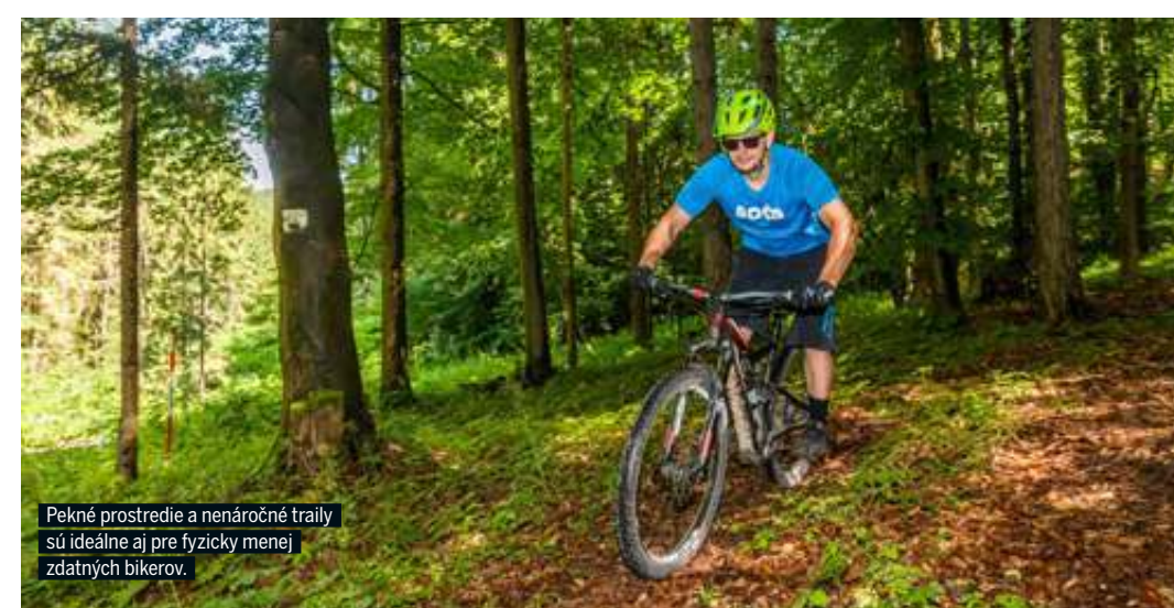
Pekné prostredie a nenáročné traily sú ideálne aj pre fyzicky menej zdatných bikerov.

naozaj perfektne. Je veľká škoda, že nemajú väčšiu podporu od štátu, cirkvi či súkromných sponzorov – táto lesná železnica má totiž potenciál byť pre celú oblasť turistickým magnetom. Tak či onak určite toto čarovné miesto pri svojej návšteve neobídte. Ak by ste sa chceli dozvedieť viac, prispieť alebo inak pomôcť, klikajte na www.katarinka.sk , nájdete tam všetky potrebné informácie.